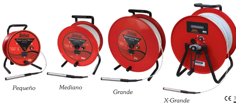
Carretes de los Niveles Modelo 101