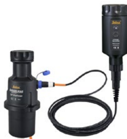
Cabezal del AquaVent y Cable Conector App