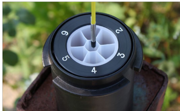
Mesure des niveaux d'eau dans les canaux étroits d'un système Solinst CMT®.

La mini-sonde de niveau d'eau 102M est proposée en longueurs de 25 mètres ou 80 pieds. Elle est munie, au choix, d'une sonde P4 ou P10.