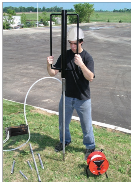
Installation de piézomètres avec un extracteur à inertie manuel

Les piézomètres à pointe de mesure peuvent être enfoncés dans le sol en appliquant toute technologie de fonçage ou de forage, y compris à l'aide d'un extracteur à inertie manuel, comme illustré ci-contre à droite. Pour éviter d'obstruer ou de salir la crépine lors de l'installation, une version munie d'une protection est également disponible.