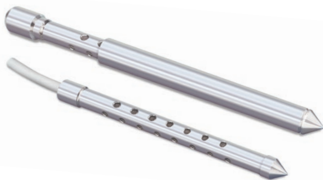
Piézomètre à pointe de mesure et protection de crépine Solinst modèle 615